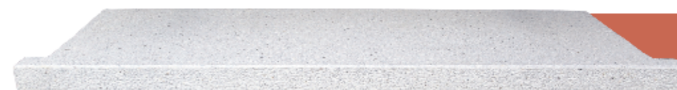
Ampit amb motllura de 6 cm