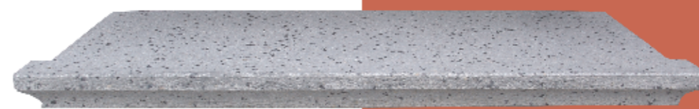
Ampit amb motllura de 7 cm