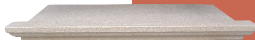
Ampit amb motllura de 8 cm