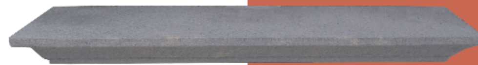
Ampit amb motllura de 10 cm